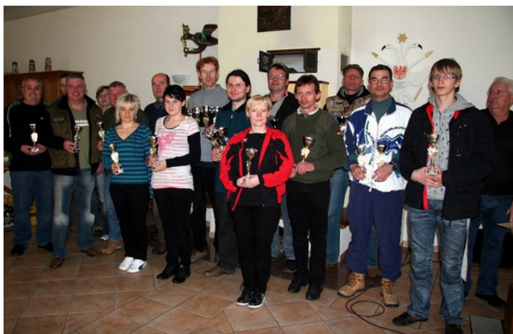
Die Sieger des Osterpokalschießens 2010

Wie in jedem Jahr am Karsamstag fanden sich die Schützen aus allen Teilen des Landes zum Osterpokalschießen in Heiligenstadt ein. Der Wettkampf ist mittlerweile ein fester Bestandteil im Jahresplan der Gäste. Leider war die Teilnahme aus den eigenen Reihen eher schwach. Dies ist sicher der Tatsache geschuldet, daß die angereisten Schützen auch bei Landesmeisterschaften vordere Plätze belegen und die Siegchance eher gering war.