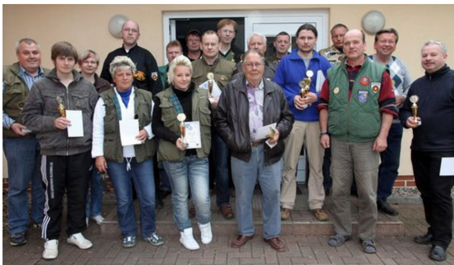
Die Pokalgewinner des Osterpokals 2011

Mit 42 Teilnehmern und insgesamt 55 Starts war der Osterpokal wieder einer der am besten besuchten Wettkämpfe im Schützenjahr 2011. Dazu waren wieder viele Schützen aus dem ganzen Land angereist - etliche davon sind mittlerweile Stammgäste auf unserer Schießsportanlage.