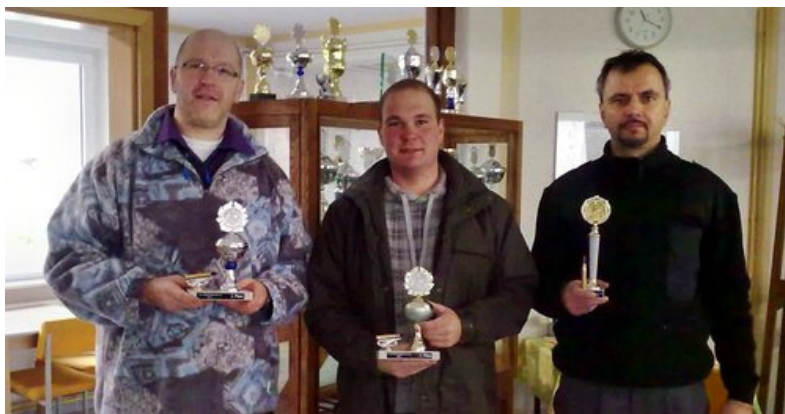
Die Sieger des Großkaliber- Halbautomaten-Cups

Zu den Jahresabschlußschießen in den Disziplinen Großkaliber / Kleinkaliber - Pistole Revolver und Halbautomat war wieder eine gute Beteiligung zu verzeichnen. Trotz trübe und kalter herbstlicher Witterung hatten die Schützen Wert darauf gelegt, an den vereinsinternen Wettkämpfen teilzunehmen. Die Sieger wurden mit Pokalen geehrt.