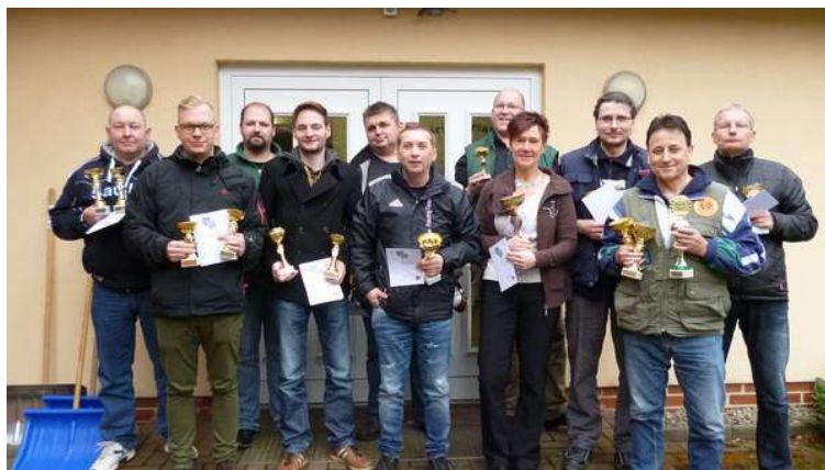
Die zur Siegerehrung anwesenden Pokalgewinner des Osterpokals

Der diesjährige Osterpokal war mit zweiundsechzig Starts wieder recht gut besucht. Selbst aus Ostthüringen waren zu diesem traditionellen Wettkampf Schützen ins Eichsfeld gekommen. Die lange Ergebnisliste ist im Downloadbereich der Homepage einzusehen.