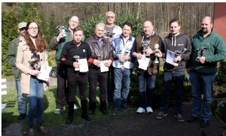
Die zur Siegerehrung anwesenden Gewinner des Osterpokals

Mit 57 Starts war das Osterpokalschießen am 1. April wieder gut besucht. Geschossen wurde in den Disziplinen Großkaliber Pistole / Revolver, Ordonnanzgewehr und KK-Gewehr Auflage. Die Schützengesellschaft durfte zu diesem Wettkampf Gäste aus dem Ober- und Untereichsfeld sowie aus Nordhessen begrüßen. Die Ergebnisse sind wie immer auf unserer Webseite zu finden.