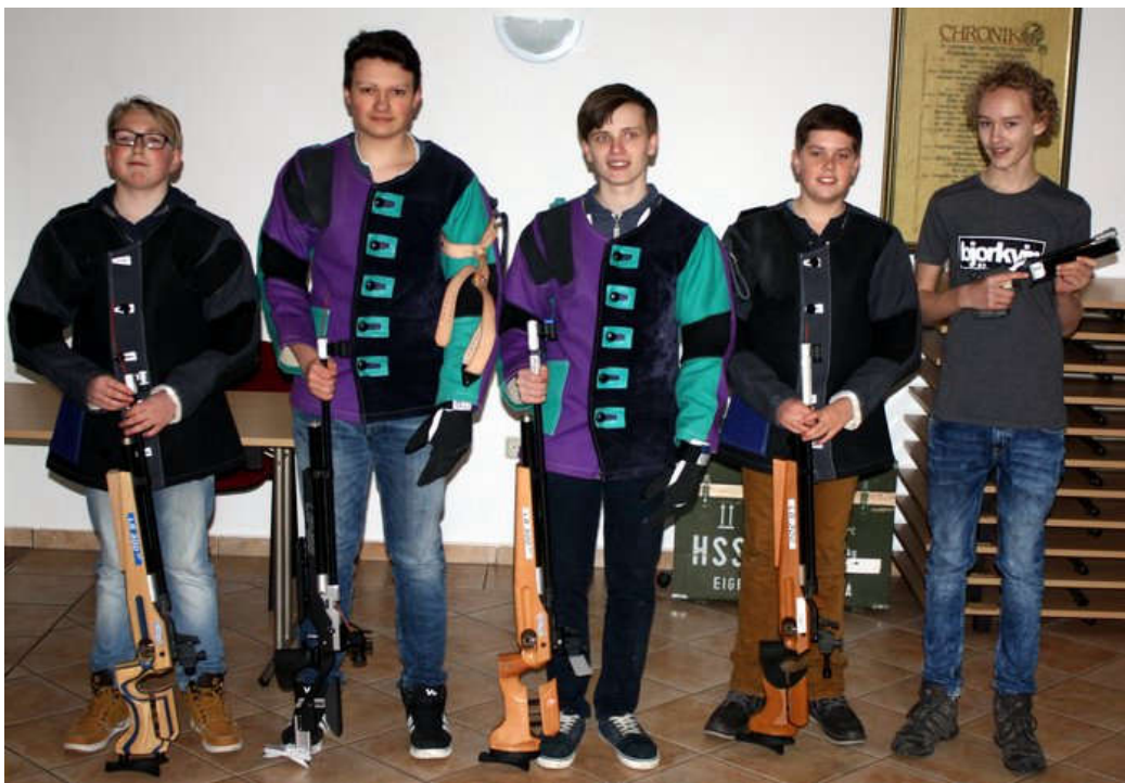
Die Jugendgruppe der Schützengesellschaft im März 2017

Herzlichen Glückwunsch an die Platzierten und ein herzliches Dankeschön an die Betreuer.