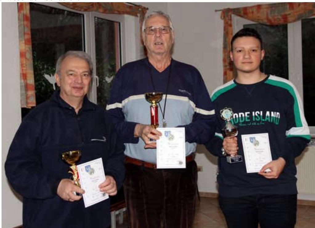
Die Sieger des Neujahrspokals 2020

Das traditionelle Neujahrsschießen der Schützengesellschaft - der erste Wettkampf des Jahres im Eichsfeld - fand wie gewohnt am ersten Samstag im Januar bei guter Beteiligung statt. Wie in jedem Jahr gab es im Anschluß eine kleine Tombola für alle anwesenden Schützen.