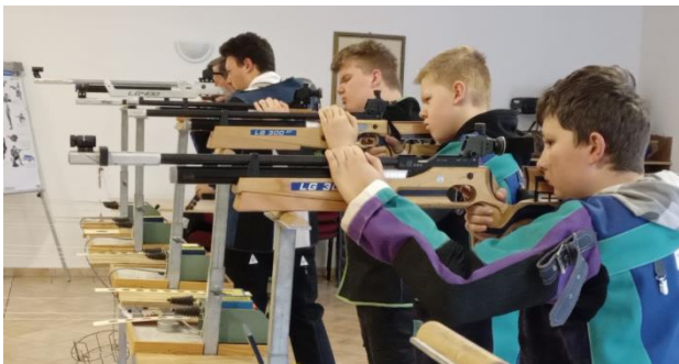
Volle Konzentration bei den Jungschützen