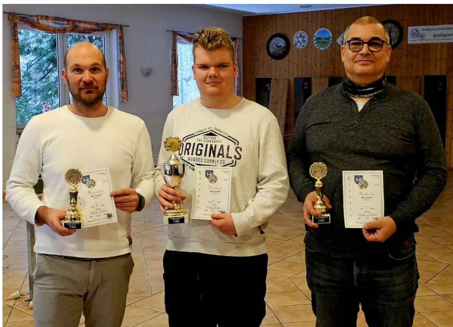
Drei glückliche Sieger des Neujahrspokals 2025

Zum traditionellen Neujahrsschießen der Schützengesellschaft von 1305 am 4. Januar, welches auch wie immer der erste Wettkampf des Jahres im Schützenkreis ist, trafen sich sechszwanzig Schützen unserer Gesellschaft auf der Sportanlage im Schellhasengraben, um die drei begehrten Pokale zu