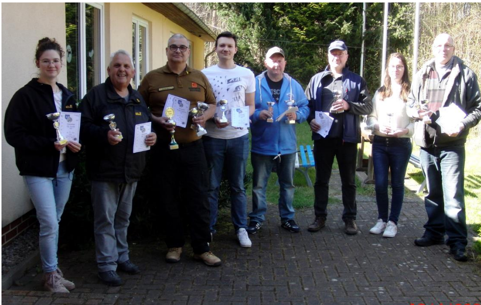
Die zur Siegerehrung anwesenden Gewinner der Osterpokale

Zum Osterpokalschießen am 12. April 2025 konnten fast alle Schützen unseres Vereins mit besseren Ergebnissen aufwarten als im vergangenen Jahr. Trotz der guten Leistungen gingen einige erste Plätze an Gastschützen.