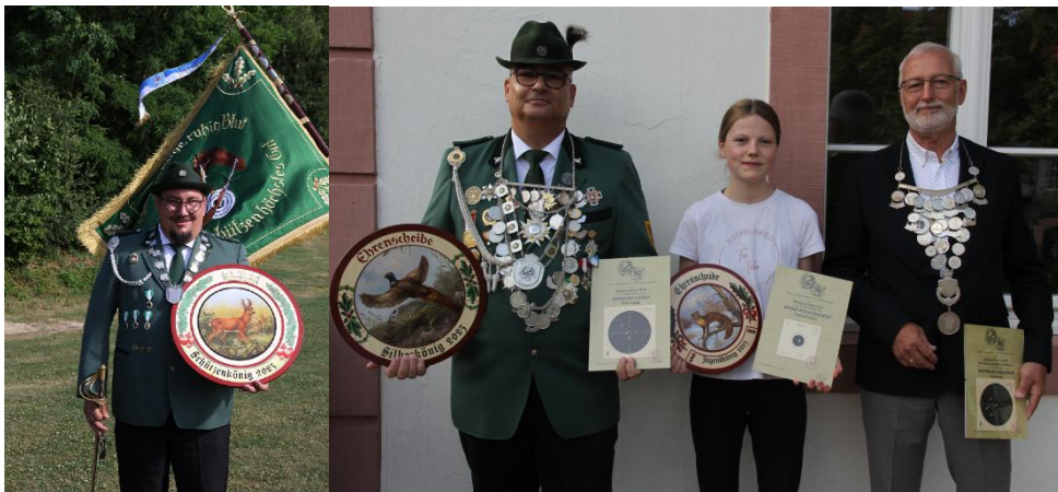
Die Heiligenstädter Majestäten 2025